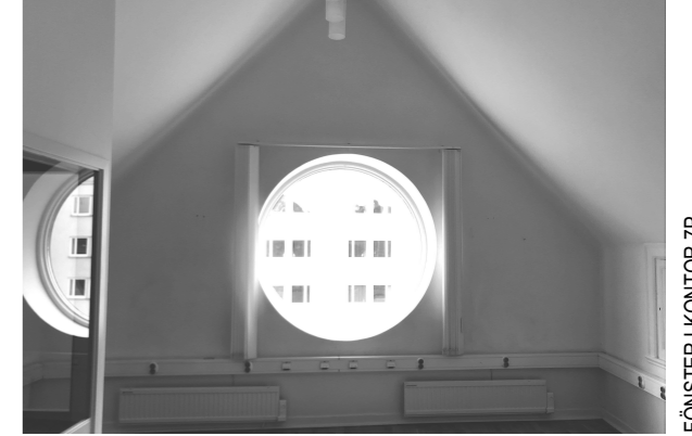
FÖNSTER I KONTOR 7P